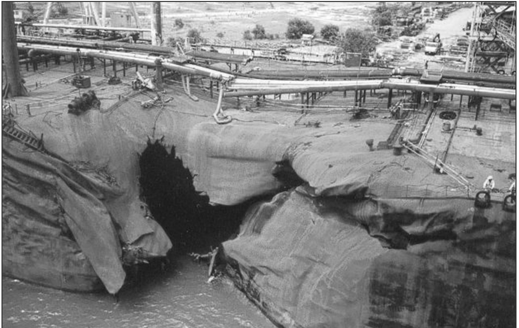
OCEAN BLESSING pløjede sin stævn direkte ind i siden på NAGASAKI SPIRIT.

handlinger potentielt kan have for verdenshandlen og for de søfolk, der er denne handels repræsentanter på havet.