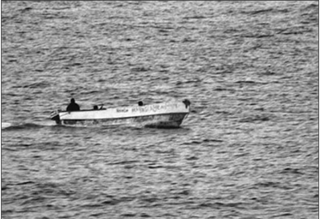
Piraterne sniger sig typisk ind på handelsskibene i små hurtige speedbåde.

Alle mennesker lever i deres egen nutid, og der er ingen grund til at tro at søfolk i 1600'tallet ikke har været ængstelige for piratoverfald, ligesom søfolk er i dag. På samme måde har flertallet af datidens sørøvere, lige så lidt som deres nutidige modstykker, gjort det for sjov og med et smil på læben. Dengang som nu handlede det om overlevelse kombineret med et håb om hurtig profit.