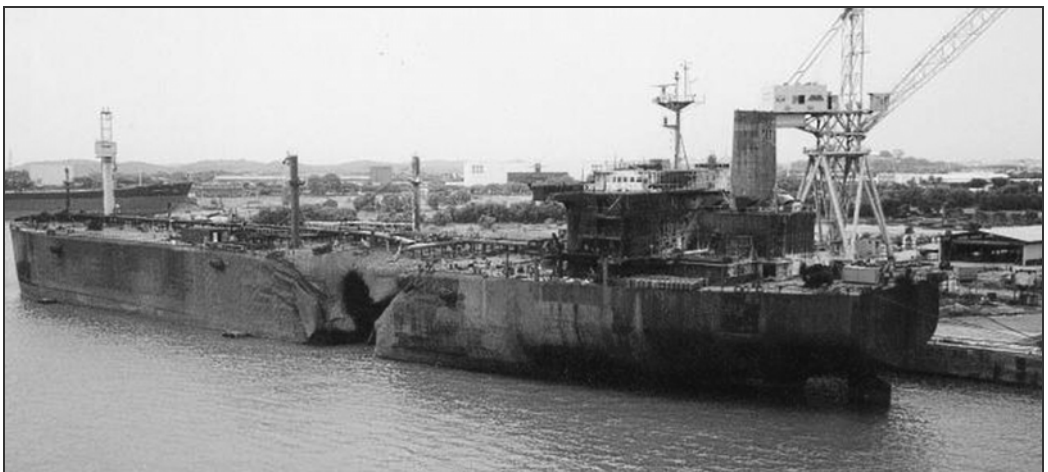
Det udbrændte vrak af NAGASAKI SPIRIT fotograferet ved Hitachi skibsværftet i Singapore.