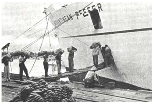
Nok var skibet moderne, men lastningen foregik ofte ved håndkraft – som her i Honduras.

Selvom ARGENTINEAN REEFER ikke blev det første skib, der ankom med bananer til København, blev det en vigtig brik i ikke blot J. Lauritzens økonomi – men også i Danmarks handel med resten af verden. En verden der efter mange år med økonomisk indadvendthed og protektionisme, i hvert fald for store områders vedkommende, åbnede sig mere og mere for samhandel og kulturel interaktion. Skibet kom derved, sammen med J. Lauritzens øvrige køleskibe, til at stå som symboler for en ny tid, der både var fredelig og dynamisk i forhold til den periode, hvor ARGENTINEAN REEFER var blevet bygget. Efterhånden blev varerationeringerne færre og færre, og almindelige mennesker fik større råderum – for eksempel til at flytte ud i de nye og åbne forstæder eller til at købe møbler designet af folk som Wegner, Jacobsen og Mogensen. Mange mennesker købte sikkert også en ekstra banan eller to.