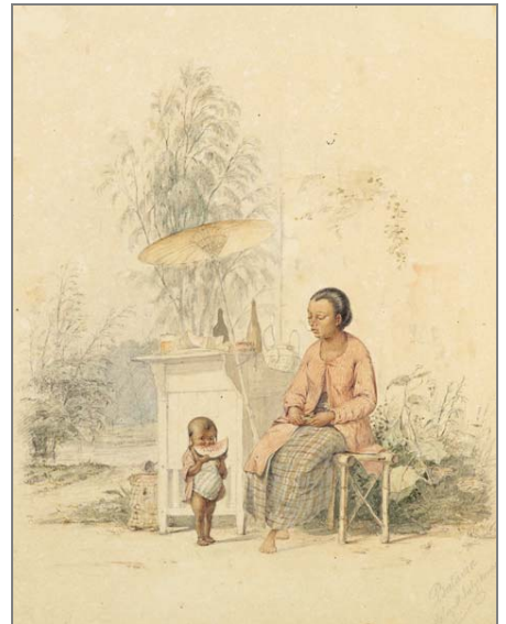
Malayisk salgerkone, Batavia 1846

Et udsnit af Plums 225 tegninger og akvareller, der idag ejes af Handels- og Søfartsmuseet, danner grundlaget for den nye særudstilling. Udstillingen kan ses frem til den 23. marts 2007.